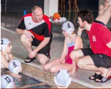
Spaß im nassen Element: Der Lehrer SV bietet auch Wasserball für Acht- bis 13-Jährige an.