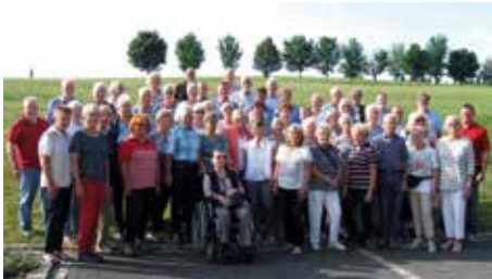
55 LSV-Senioren nehmen Abschied vom Erzgebirge

re Heimreise. Natürlich nicht mit direktem Ziel Lehrte, sondern mit einem kleinen Umweg über Dresden, wo wir zuerst mit einer Schwebbahn einen steilen Elbhang hinauffahren. Auf der Bergstation, in etwa 85 Metern Höhe, bot sich uns ein Panoramablick über die Stadt, über das Elbtal und den Fluss. Doch die sonst so breite Elbe war schmal geworden, auch