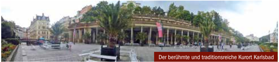
Der berühmte und traditionsreiche Kurort Karlsbad

oben ankommen. Doch auf dem Weg zum Schloss stoppte unser Bus unversehens auf der schmalen ansteigenden Straße wie auch der davor fahrende LKW, und hinter uns bildete sich schnell eine Schlange nachfolgender Autos. Es gab kein Vor und kein Zurück. Ein Verkehrsunfall. Es dauerte lange, bis der Rettungswagen eintraf und der Bus dank der bewundernswerten Fahrkünste unseres Fahrers Victor die Fahrt über die ihm zugewiesene Umleitung durch noch schmalere Straßen fortsetzen konnte. Derweil hatte die Gruppe der Seilbahnfahrer lange auf uns gewartet und auch schon einen Teil des Vortrags zur Schlossgeschichte gehört. Den Rest hörten wir uns dann gemeinsam an, jedoch war die Referentin darüber „not amused“.