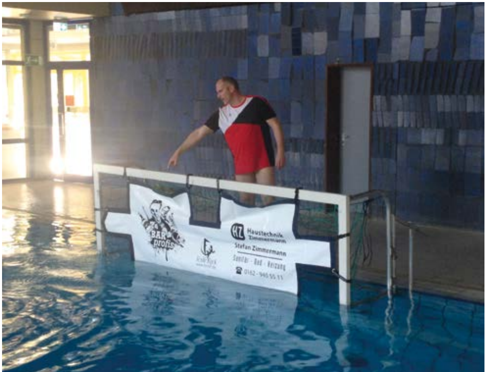
Immer wieder eine Herausforderung: Wer trifft die Schwachstellen eines jeden Torwarts?