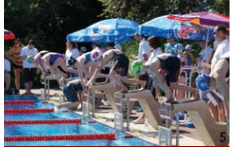
Viel Sonne und ein modernes Ambiente: 15 Vereine waren beim 37. Sommerschwimmfest der SG Lehrte/Sehnde im Lehrter Freibad am Start.

Die Kombination der Schwimmabteilungen des Lehrter SV und des TV Eintracht Sehnde setzt einmal mehr auf ein buntes, sportliches Programm: Dieses reicht von Nachwuchsrennen der Achtjährigen über die 50-Meter-Strecken bis hin zu den beinahe olympisch anmutenden Entscheidungen über die 400 Meter Freistil.