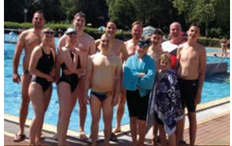
Die Wasserballer gingen in einem Einlagerennen mit gleich drei Staffeln an den Start.

Mit Sonnenschein satt und modernem Ambiente lockte das 37. Sommerschwimmfest der SG Lehrte/Sehnde, das bei tropischen Temperaturen im Lehrter Freibad ausgetragen wurde. Die gastgebende Startgemeinschaft der Schwimmabteilungen des Lehrter SV und des TV Eintracht Sehnde hatte mit dem Erwerb wellenbrechender Trennleinen neue Standards