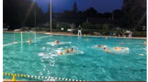
Nicht alltäglich: Das letzte Freibadspiel kam in Hildesheim unter Flutlicht zur Austragung.

Das Hinspiel war überraschend mit 8:6 an den Altkreisvertreter gegangen, und auch der Rückkampf an der Innerste bescherte eine flotte Partie. Die Lehrter ließen sich dabei auch von einem zwischenzeitlichen 4:8-Rückstand (16. Minute) nicht abhängen und kamen im Schlussabschnitt auf 9:10 und 10:11 heran. Auch der erneute Anschlusstreffer zum 11:12 war so gut wie fällig, doch Ole Roths letzter Wurf schlug erst